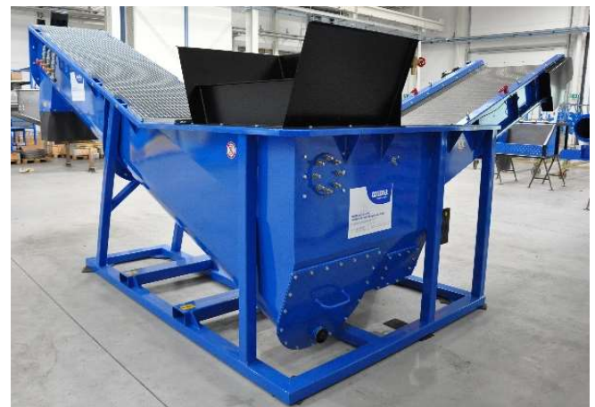
HDS-S Ansicht Aufgabetrichter und Revisionsöffnungen