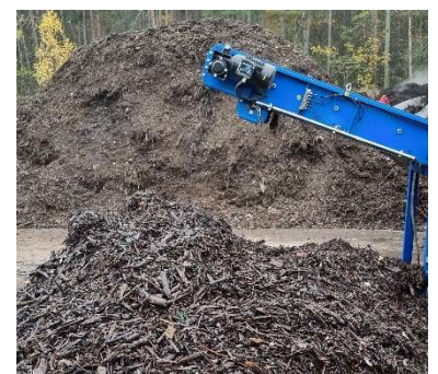
HDS-S separierte Leichtfraktion