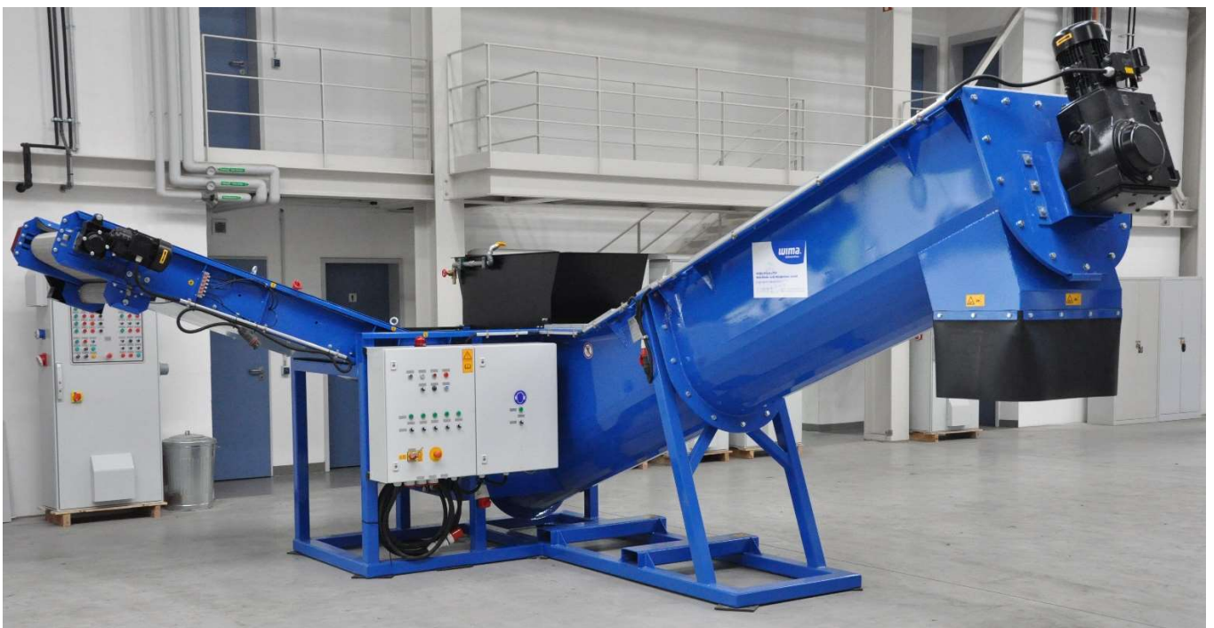
HDS-S Ansicht Schneckenförderer, Schaltschrank und Austragsband

Mit Hilfe der Strömungsgeschwindigkeit können Materialien mit einer Dichte von > 1\text{g/cm}^3 in die Leichtfraktion überführt werden.