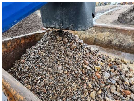
HDS-S separierte Schwerfraktion